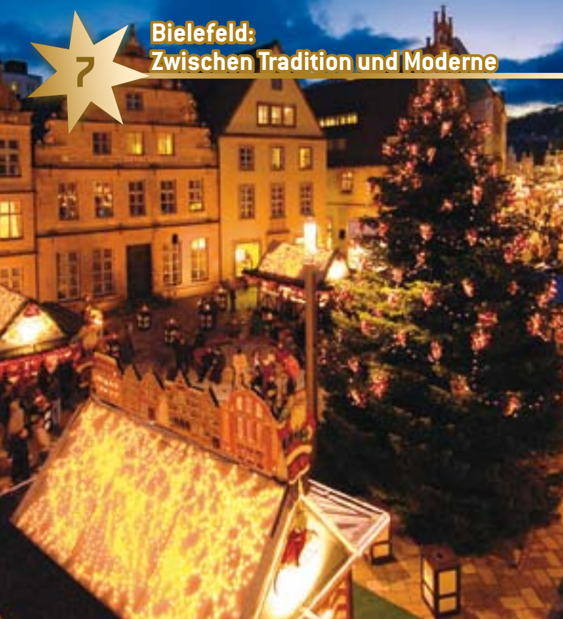
Der Alte Markt mit seinen Patrizierhäusern wirkt besonders festlich.

Ob beschaulich oder lebhaft, traditionell oder modern – der Bielefelder Weihnachtsmarkt bietet in der gesamten Innenstadt für jeden Geschmack etwas. Besonders festlich wirkt der Alte Markt: Liebevoll restaurierte Patrizierhäuser bieten eine eindrucksvolle Kulisse. Die Dächer der Fachwerk-Buden sind mit einer Schneelandschaft bedeckt und hübsch beleuchtet. Auf dem Altstädter Kirchplatz geht es zünftig zu, fast wie im Skiurlaub: In der Hüttenlandschaft „Haus vom Nikolaus“ gibt es Feuerzangenbowle und der sprechende Elch sorgt für Gaudi. Trendig und urban ist es am Jahnplatz: Der Verkehrsknotenpunkt der Innenstadt präsentiert sich als rotes Dorf mit funkelndem Sternenhimmel.