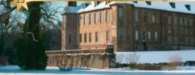
Schloss Dyck lädt zum Weihnachtsmarkt und Winterspaziergang ein.

Es duftet nach Tannengrün, Plätzchen und gebrannten Mandeln. Feuerkörbe sorgen für anheimelnde Wärme. Chöre der umliegenden Gemeinden stimmen im Schlosshof Weihnachtslieder an. Der Markt rund um Schloss Dyck ist ein Fest für alle Sinne: Selbstverständlich kann man dort auch schlemmen. Rund 150 Aussteller gestalten an den ersten drei Adventswochenenden einen Weihnachtsmarkt mit besonderem Flair. Alte Handwerkskunst wird live vor Ort demonstriert – z. B. zeigt eine Klöpplerin ihr Können.