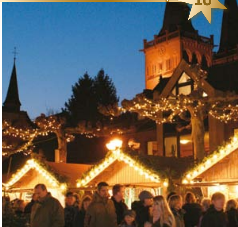
Xanten bietet einen besinnlichen Weihnachtsbummel mit Blick auf den Dom.

Ruhig und besinnlich, so präsentiert sich der Weihnachtsmarkt in Xanten. Besucher können hier gemütlich stöbern und Geschenke kaufen. Auf dem neu gestalteten Marktplatz mit Blick auf den Dom bieten die rund 40 Aussteller beispielsweise Schmuck, Räucher-männchen aus dem Erzgebirge, Honig und Kerzen, handgeschnittene Weihnachtsartikel sowie Speisen aus der Region. Statt blinkender Fahrgeschäfte gibt es für Kinder traditionelle Spielzeuge aus Holz und Metall.