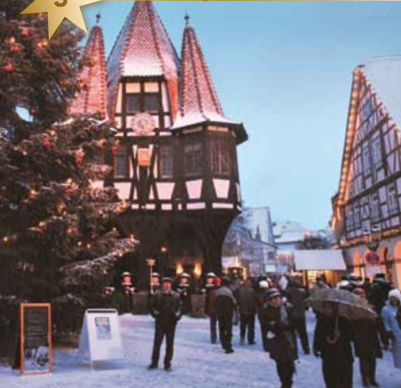
Rund um das historische Rathaus verläuft der Weihnachtsmarkt.

Zwischen den sanften Bergen des Odenwaldes liegt Michelstadt. Betritt man durch die mittelalterliche Stadtmauer die Altstadt, scheint es, als wäre die Zeit stehen geblieben. In schmalen Gassen zwischen original erhaltenen Fachwerkhäusern stehen viele kleine Buden, die ausgefallene Geschenkartikel und kulinarische Spezialitäten anbieten. Auch die mittelalterlichen Plätze mit dem über 500 Jahre alten Fachwerk-rathaus und dem Kellereihof sind Teil des Michelstädter Weihnachtsmarktes.