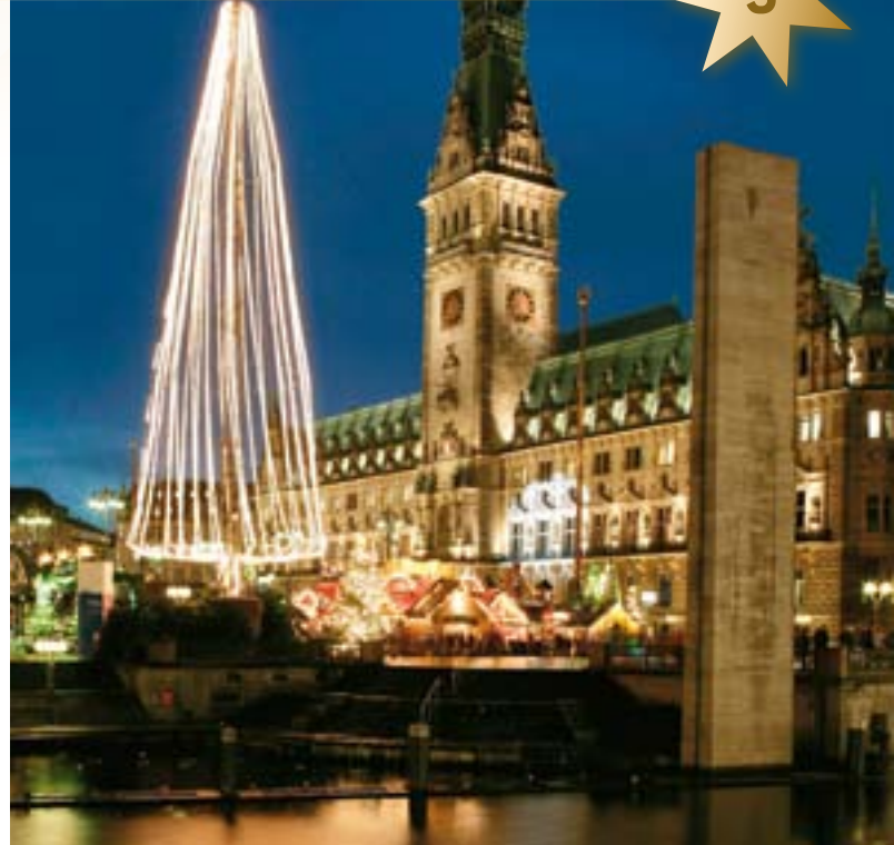
Der historische Weihnachtsmarkt vor dem Rathaus bietet nostalgisches Flair.

Die Weihnachtszeit in Hamburg ist ein ganz besonderes Erlebnis – maritim, märchenhaft und mancherorts auch frivol. Zwölf Weihnachtsmärkte, davon sieben in der Innenstadt, laden zum Bummeln und Verweilen ein. Dabei hat jeder der Märkte seinen eigenen Charme. Das Besondere in Hamburg: Hier können Besucher sechs Wochen lang das weihnachtliche Flair genießen.