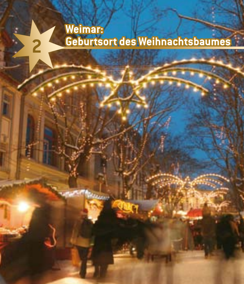
Die ganze Innenstadt ist während des Weihnachtsmarktes festlich geschmückt.

„Weimarer Weihnacht“ – das ist nicht Rummel und Trubel, sondern ein Ort, an dem Kinder und Erwachsene noch ins Staunen kommen. Theater für die Kleinen, Geschichten von den Großen, traditioneller Weihnachtsschmuck aus dem Erzgebirge, Glasbläsereien aus Lauscha und Spielzeug aus Holz und Blech für den Gabentisch. Auf dem Marktplatz wird die „Weihnachtswerkstatt“ aufgebaut: Hier zeigen Handwerker wie Schnitzer, Tischler und Schneider ihr Können und bieten eine gute Gelegenheit, nicht alltägliche Weihnachtsgeschenke zu kaufen.