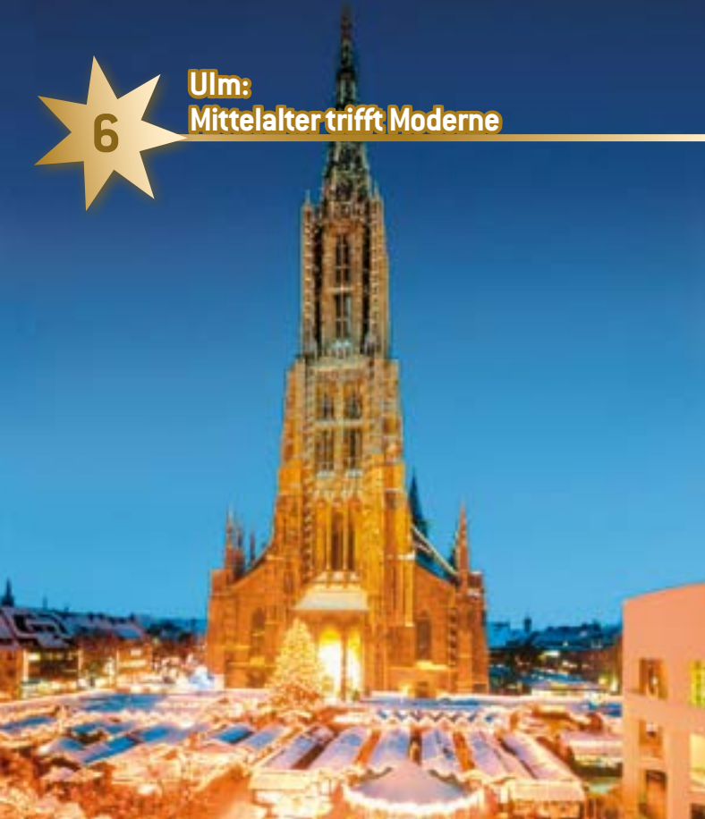
Das Ulmer Münster steht im Mittelpunkt des Weihnachtsmarktes.

Diese Kulisse ist einmalig: Direkt vor dem höchsten Kirchturm der Welt verwandeln festlich dekorierte Holzbuden den Münsterplatz in eine kleine „Stadt in der Stadt“. Kulinarische Spezialitäten, Spielzeug, Kunsthandwerk und Christbaumschmuck sowie ein Schafstall mit lebenden Tieren machen den Ulmer Weihnachtsmarkt vier Wochen lang zum wichtigsten Ereignis in der Stadt. Dieses Jahr hat der Markt vom 22. November bis 22. Dezember täglich von 10 bis 20.30 Uhr geöffnet.