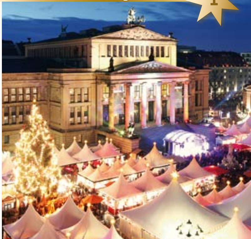
Der Gendarmenmarkt bietet eine herrliche Kulisse für den „Weihnachtszauber“.

Jedes Jahr zur Vorweihnachtszeit riecht die Berliner Luft nach gebrannten Mandeln, Lebkuchen und Glühwein. Die Stadt strahlt in festlichem Lichterglanz. Rund 60 Weihnachtsmärkte auf großen Boulevards und Plätzen, aber auch in kleinen Seitengassen und in Museen überraschen mit Budenzauber, Charme und Bühnenprogramm. Wir stellen Ihnen eine Auswahl schöner und außergewöhnlicher Märkte vor.