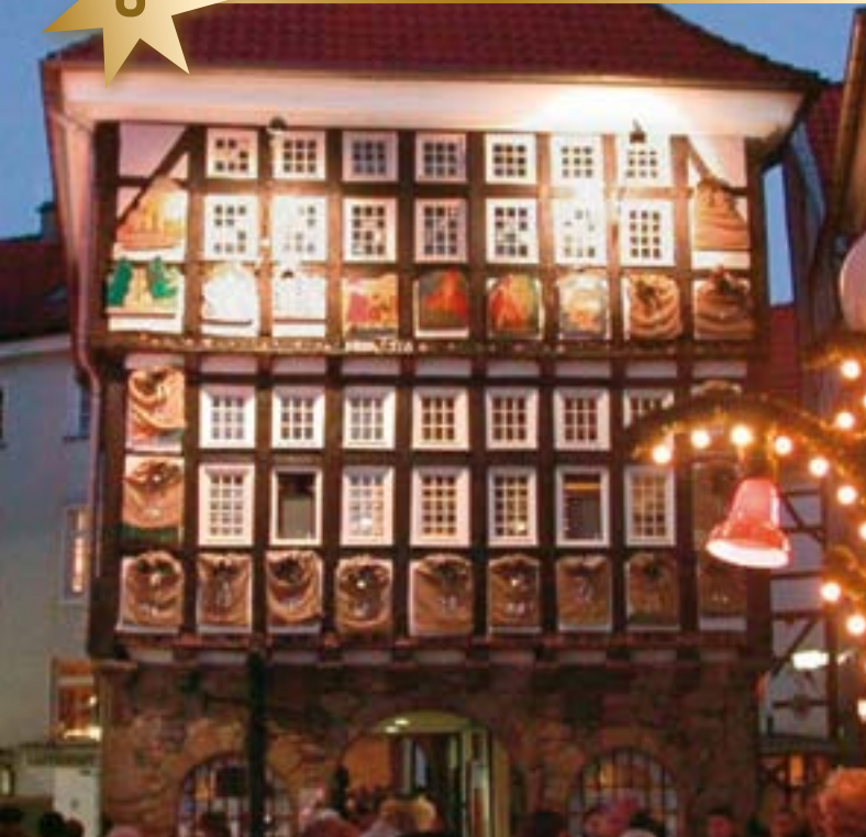
Im historischen Rathaus wohnt Frau Holle und öffnet täglich ein Kalendertürchen.

Hattingen liegt mitten im Ruhrgebiet und bietet mit seiner verwinkelten Fachwerk Altstadt mittelalterliches Flair. Rund um den schiefen Turm der St.-Georgs-Kirche bildet eine Gruppe von rund 150 gut erhaltenen und restaurierten Fachwerkhäusern eine der schönsten Altstädte Deutschlands. In dieser gemütlichen Atmosphäre laden vom 22. November bis zum 22. Dezember rund 80 verschiedene Stände und Büdchen zum Bummel über den „Nostalgischen Weihnachtsmarkt Hattingen“ ein.